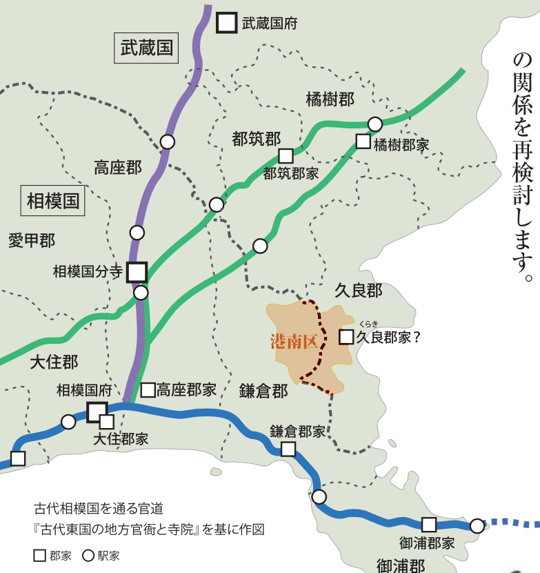
古代相模国を通る官道 『古代東国の地方官衙と寺院』を基に作図 □ 郡家 ○ 駅家

神奈川では、最近史跡指定された川崎市の橘樹官衙遺跡群（武蔵国橘樹郡家）や茅ヶ崎市の下寺尾官衙遺跡群（相模国高座郡家）など、古代郡役所の姿が明らかになっていきます。郡役所は、律令国家が中央集権的な地方統治をどう実現したのかを知るカギとなります。その構造・機能や道を読み解き、古代の中央・地方の関係を再検討します。