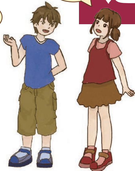
イラストは『親子で読むふるさと港南の歴史』より