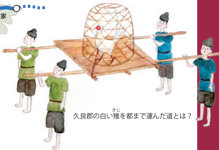
久良郡の白い雉を都まで運んだ道とは？